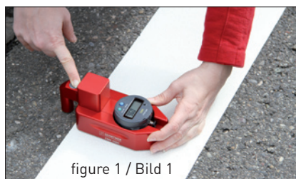
figure 1 / Bild 1