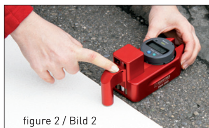
figure 2 / Bild 2