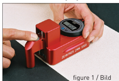
figure 1 / Bild