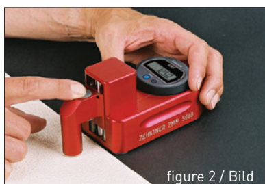
figure 2 / Bild